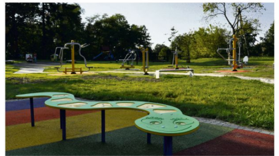
Ogród sensoryczny w Zaborze finansowany z funduszu sołeckiego zaczęto budować tego lata.

Główne przedsięwzięcie finansowane ze środków sołek to budowa ogólnodostępnego odcinka sensorycznego w zielonych terenach Przedszkola Samorządowego. Pierwszy etap prac (część fitness) zakończono w sierpniu. Sołtyś Adam Nowotarski jeszcze je, że inwestycja potrwa jeszcze