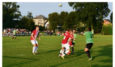
Broszkowiczanie powrócili na boiska oświęcimskiej klasy A po długich szesnastu latach. Ich głównym celem będzie utrzymanie się na tym poziomie rozgrywkowym.

Pozostałe spotkania broszkowiczanie przegrali z Górnikiem Broszkowice 2:6, z Orłem Witkowiec 3:1. Bobkikom na wyjeździe 3:1. Przeciszovia 2:4 i Bulowicami na wyjeździe 6:3).