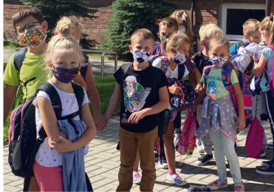
Uczniowie Szkoły Podstawowej w Rajsku.

i termometrów bezdotykowych, a Gmina zapewnia transport tych środków do poszczególnych obiektów. Gmina Oświecim jako organ prowadzący szkoły i przedszkola zabezpieczyła również środki finansowe, które w razie wystąpienia niedoborów, pozwolą uzupełnić środki ochrony indywidualnej (przebiły, maseczek i rękawiczek).