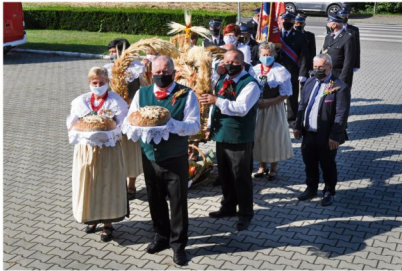
Dożynki w Rajsku.

Dożynki 2020: Poręba Wielka – 15 sierpnia Grojec – 15 sierpnia